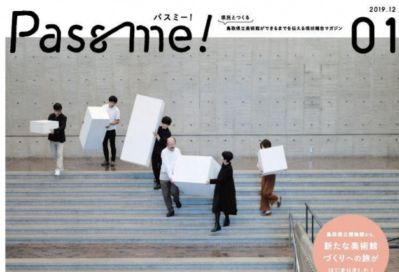
2024年度、鳥取県・倉吉に「未来をつくる」美術館が生まれます!